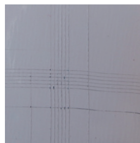
DEGALAN® LP 65/12