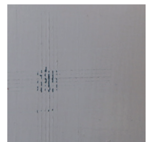
DEGALAN® LP 65/11