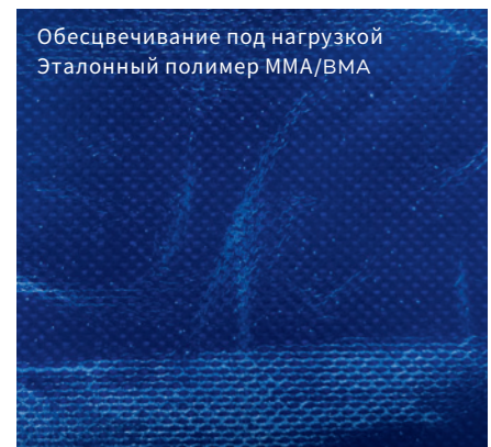
Обесцвечивание под нагрузкой Эталонный полимер ММА/ВМА

Стартовые рецептуры предоставляются по запросу.