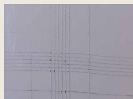
DEGALAN® LP 65/12