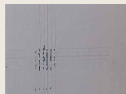
DEGALAN® LP 65/11

Стартовые рецептуры и образцы предоставляются по запросу.